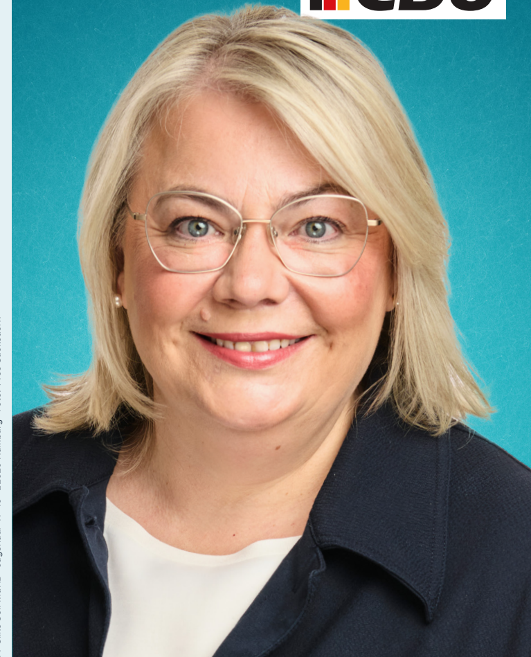
Vi.S.d.P.: Silke Seif MdHB · Jägerlauf 41-45 · 22529 Hamburg